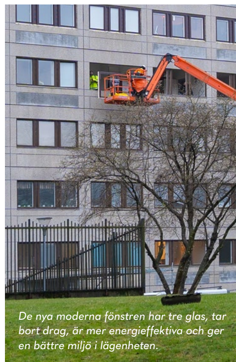
De nya moderna fönstren har tre glas, tar bort drag, är mer energieffektiva och ger en bättre miljö i lägenheten.