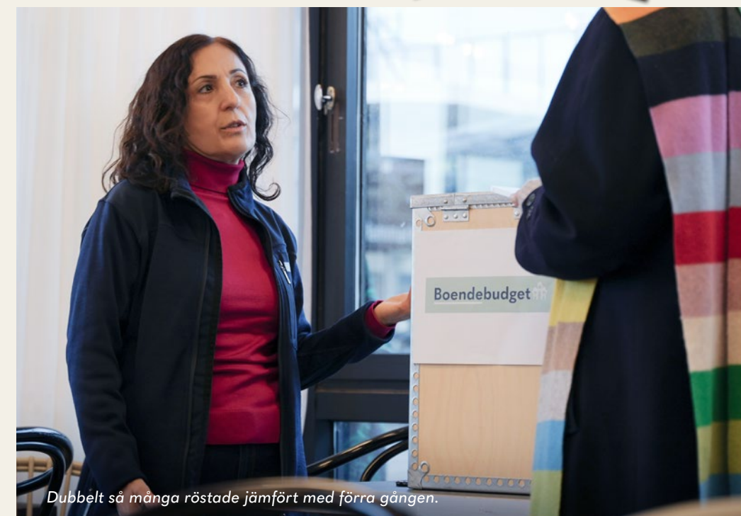
Dubbelt så många röstade jämfört med förra gången.

– Folkets Hus är som ett nav här i Hammarkullen. Vi vill gärna samarbeta med dem eftersom de har perfekta lokaler för dans. Dessutom har de kontakt med