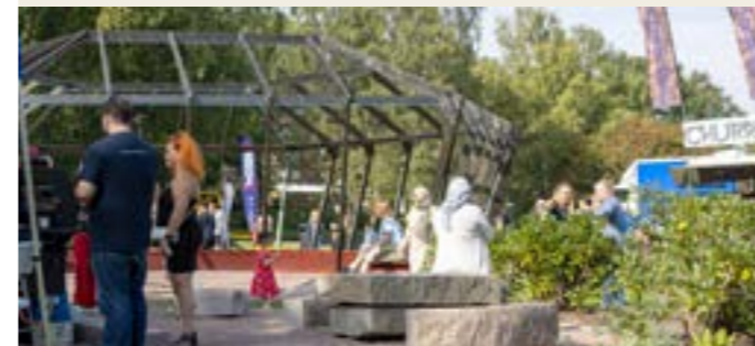
En juvelli liknande formation på mötesplatsen knyter an till områdets gator som alla har namn efter ädelstenar.