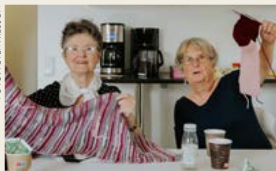
Både stämningen och produktionstakten är hög på stickcaféet i Västra Järnbrott.