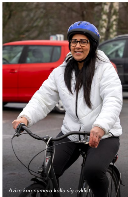
Azize kan numera kalla sig cyklist.

OBS! Antalet deltagare är begränsat, först till kvarn gäller. Mer information finns i Bostadsbolagets app.