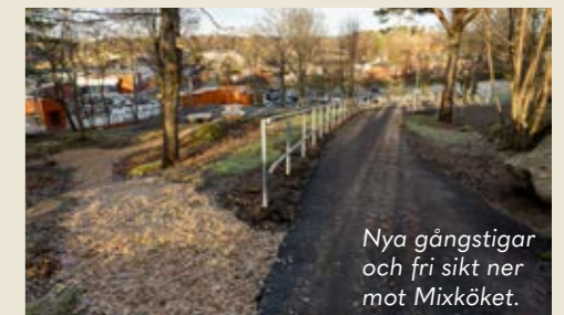
Nya gångstigar och fri sikt ner mot Mixköket.