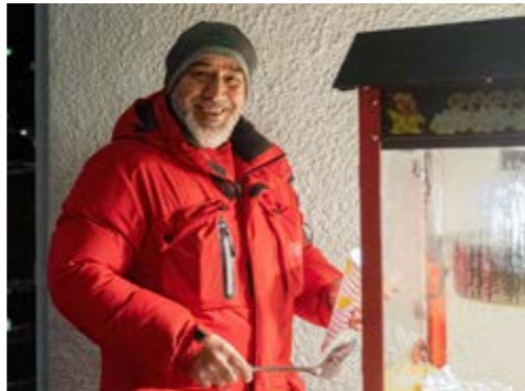
Bostadsbolagets trygghetsvärd, Wahedlanden, serverade popcorn.