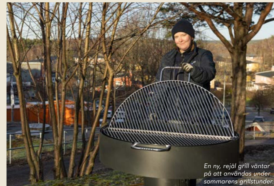
En ny, rejäl grill väntar på att användas under sommarens grillstunder.

” Vi behöver få bättre kontakt med Bostadsbolaget.