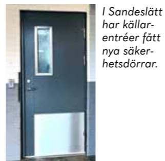
I Sandeslätt har källarentréer fått nya säkerhetsdörrar.