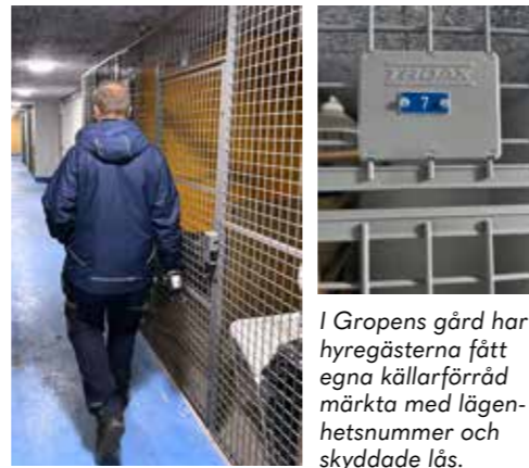
I Gropens gård har hyresgästerna fått egna källarförråd märkta med lägenhetsnummer och skyddade lås.

– Det blev väldigt bra när vi målade om inne i miljöhusen. Vi skapade även en återbrukshylla där alla hyresgäster kan