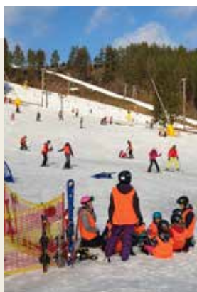
Lite vila mellan åken med skidskolan var behövligt.