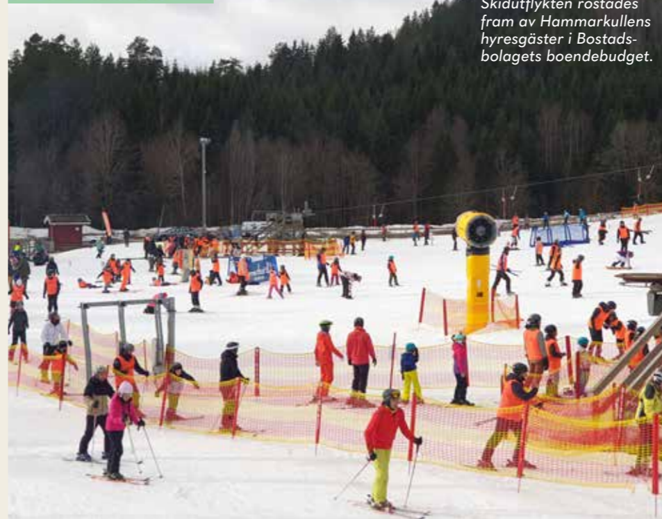
Skidutflykten röstades fram av Hammarkullens hyresgäster i Bostadsbolagets boendebudget.