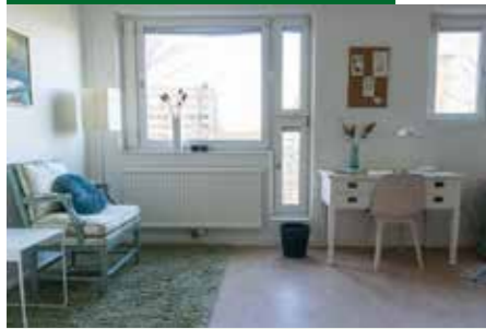
Möbler och inredning kommer från den populära secondhandbutiken Reningsborg.