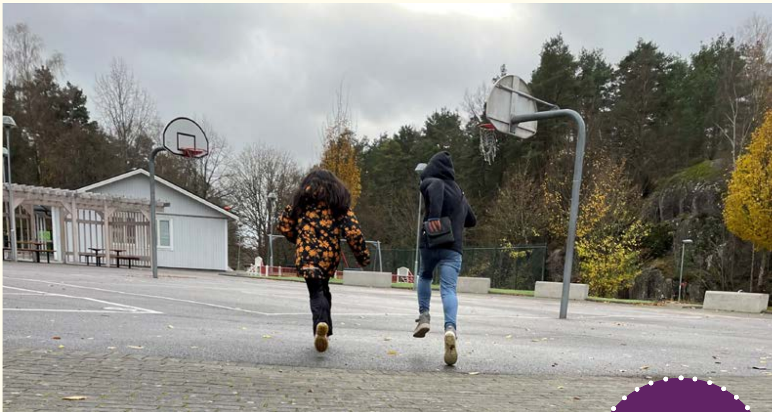
I en text om mörka vinterkvällar efterlyser barnen en tryggare utomhusmiljö.