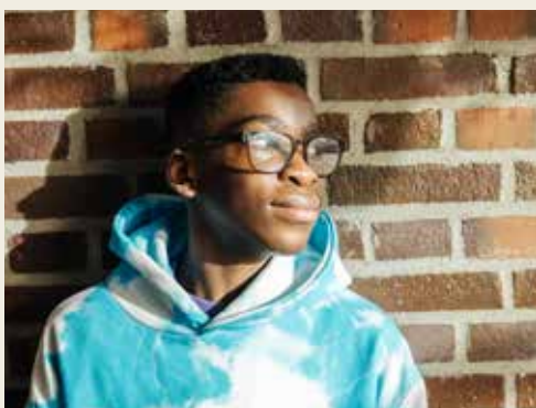
Corneille ser ljus på framtiden.