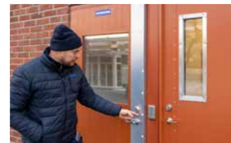
För ökad trygghet och säkerhet har dörrar till tvättstugor och kallare fått fönster och nya brytskydd.