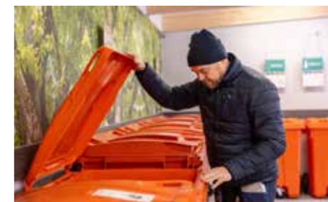
Nu blir det lätt att slänga rätt! På väggarna i det nya miljöhuset finns tydliga instruktioner vad som ska sorteras i de olika sopkärlen.