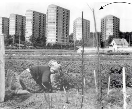
Så här såg det ut när Kommandobryggorna var nybyggda i början på 1960-talet och landsbygden fortfarande fanns in på knuten.