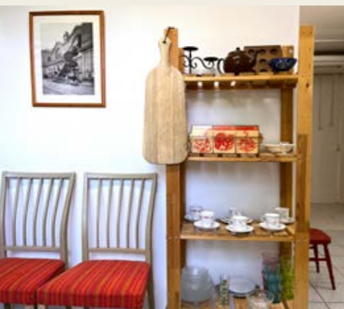
Här finns fina saker att återanvända.

Anmälan: Senast den 4 november till Cecilia.Baffoe@bostadsbolaget.se