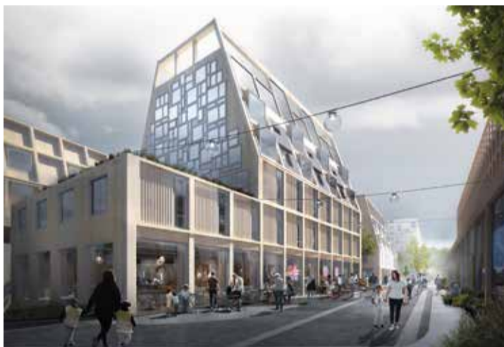
Från Hammarbadets entré syns bostadshusen med butiker och andra lokaler i bottenvåningarna

"Tillsammans" är en strukturplan som värnar om en miljö med öppna och flexibla platser där fler kan känna tillhörighet och inspireras. Där invånare och aktörer kan, vet och vågar medskapas och samskapa i utvecklingen av stadsdelen och Hammarkulletorget.